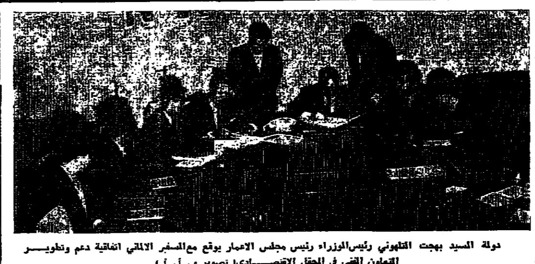
دولة السيد بهجت القنوني رئيس الوزراء رئيس مجلس الامارات يوقع مع السفير الاتماني اتفاقية دعم وتطوير التعاون الفني في الحقل الاقتصادي

الرفاعي في بيروت بطريقته في نيويورك لما هبطها بمسؤوليها حول تنفيذ قرار مجلس الأمن بيروت - اقلية - استقبل الرئيس شارل حلو بعد ظهر أمس السيد عبد المنعم الرفاعي وزير الخارجية الأردنية وكرت مصاصر رسمية أن البحث بين الرئيس حلو والسيد الرفاعي تناول الوضع العربي المصام مناسبة قرب اجتماع الجمعية العامة للأمم المتحدة في دورتها الجديدة التي تبدأ يوم الثلاثاء القادم.